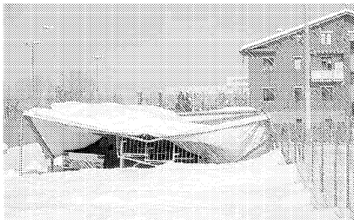
La tribunetta dello stadio da calcio 'Ferrari' di Fiorano, crollata sotto il peso della neve. L'incidente poteva avere conseguenze più gravi