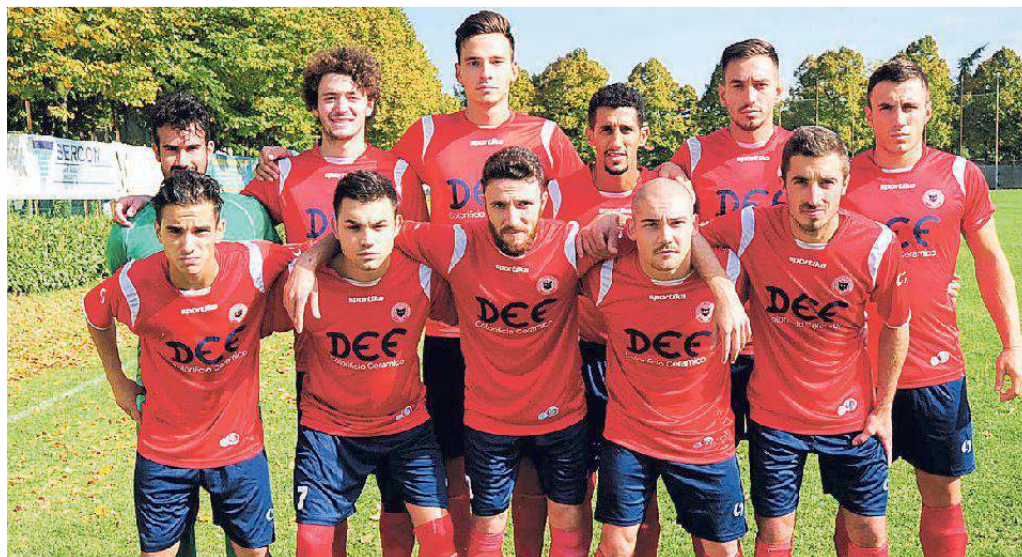
Il Fiorano può sorridere: espugna Soliera e d'ora è secondo in classifica

vo è raggiungere al più presto i quaranta punti e raggiungere la salvezza, solo dopo potremo pensare a toglierci qualche soddisfazione in più. Sarà un torneo molto equilibrato perché ci sono diverse formazioni che possono fare la voce grossa e puntare alla promozione. Cercheremo di vendere cara la pelle con tutti - conclude Saetti Baraldi spronando ancora di più i compagni - a partire dalla difficile sfida di domenica prossima contro la Virtus Castelfranco». (d.b.)