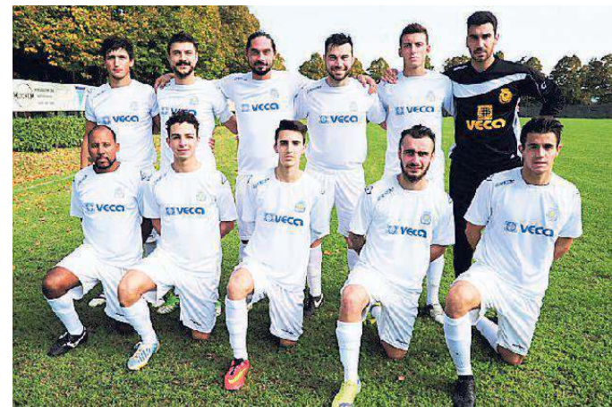
L'undici iniziale della Solierese sceso in campo ieri